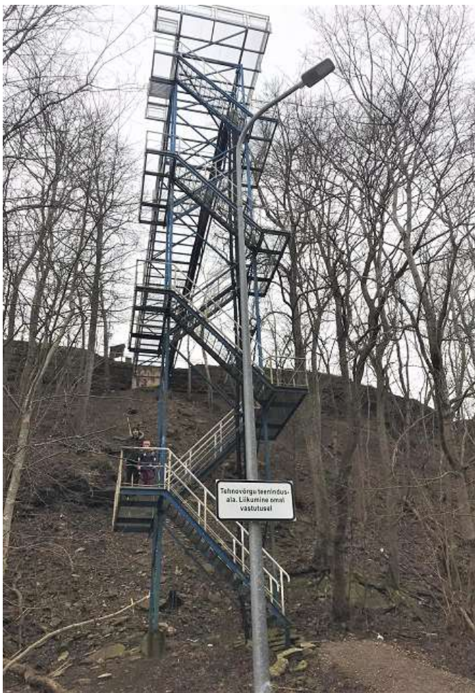
Foto 1. Olemasolev Meriküla teel paiknev torustikutorn ja keerdtrepp.

Meriküla tee on transpordimaa sihtotstarbega munitsipaalomandis olev maa, (katastritunnus 19801:001:2031). Ehitisregistrisse, koodiga 220283934, on rajatisena kantud teel olev torustikutorn ja keerdtrepp (foto 1), mis rajati Muraste uuselamurajooni ehitamise algusaastatel piirkonna arendaja poolt u 2003. aastal. Rajatise ehitamise eesmärk oli juhtida tulevase elamurajooni reovesi klindi all olevasse reoveepuhastisse ning lisaks võimaldada elanikel klindist üles ja alla liikuda. Reoveetorustik on tornist likvideeritud ning on aastaid tagasi seoses Meriküla puhasti ehitamisega paigaldatud maasse.